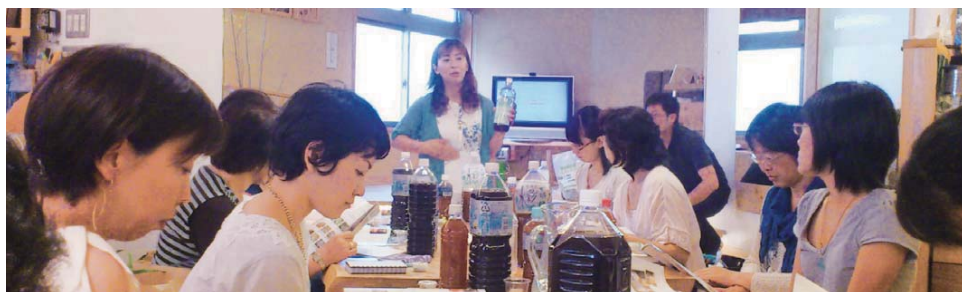
講習会の様子。一気に30人くらいにEMをお伝えできた時もありました。

息子の通う幼稚園から始めて、友達のおうちとか、天然住宅の会社さんが開催するセミナーにも呼んでいただきました。ふと気付くと、とくに100人は超えていました。